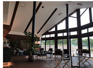
↑施設内もお洒落な空間です

ところで、ビジネスマンの方々のオフといえば、週末や公休日だけではなく入社してから一定期間が経過した後に付与される「年次有給休暇」がありますね。年次有給休暇は労働者に与えられた権利ですが、実際に権利を行使するのはそう簡単でない場合も多いです。そのため退職時にまとめて取得される方も多くいらっしゃいます。むしろ今では退職時の有給休暇を使って転職活動を行われる方が多いかも知れません。しかし年次有給休暇の本来の目的は「週休日とは別に、賃金の保障された一定の日数の休暇を付与することによって、労働者の心身のリフレッシュを図ること」です。中小企業の実態と照らすとなかなか普段の取得は難しいですが、現状のままでは本来の意味が薄れてしまっているように感じるこの頃です。