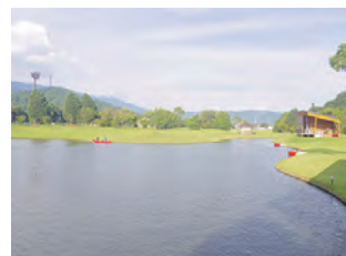
↑大きな池でカヌーを満喫♪